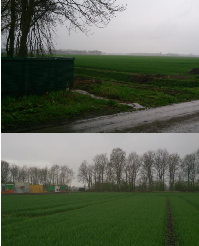
Figuur 2: bestaande situatie