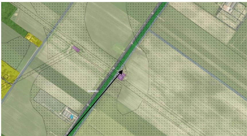
Figuur 1: locatie mestzak

In bijlage 2 een overzichtstekening met de percelen van Berg Landbouw.