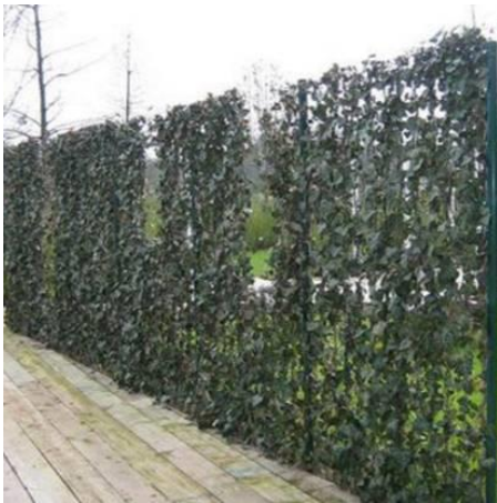
Figuur 4: hekwerk begroeid met Hedera

Op de gewenste locatie is de mestzak volledig uit het zicht onttrokken vanaf de openbare weg. Landschappelijk inpassen door het hekwerk te laten begroeien met Hedera zorgt ervoor dat zowel het hekwerk als de mestzak uit het zicht worden onttrokken (figuur 4).