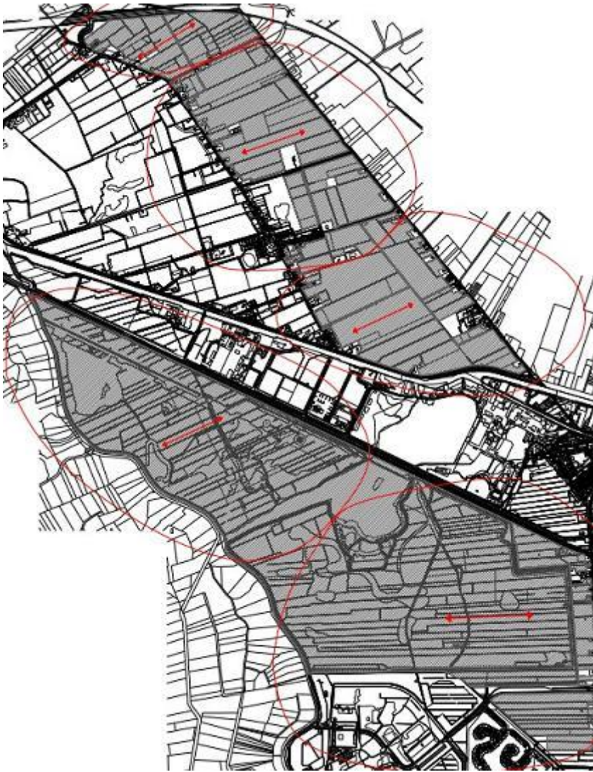
Kaart 2 Westelijk van Hoogezand